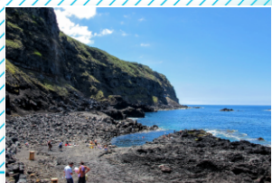
Piscina termal natural Natural thermal swimming pool