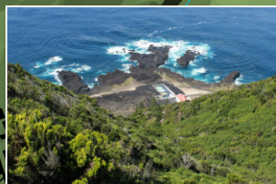
Vista sobre a Ponta da Ferraria View over Ponta da Ferraria