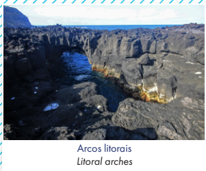
Arcos litorais Litoral arches