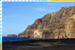
Vista para a arriba fóssil View to the fossil cliff