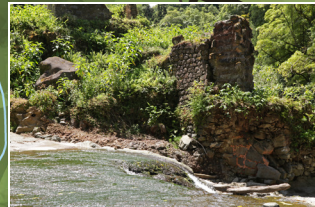
Azenha em ruínas - Moinhos do Januário Old watermill - Moinhos do Januário