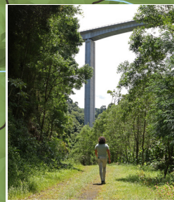
Passagem pelo viaduto da Euroscut Euroscut viadut passage