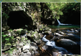
Moinhos do Crim Watermills - Moinhos do Crim