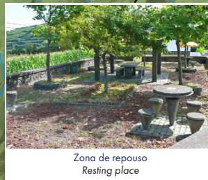
Zona de repouso Resting place

Parque Natural de São Miguel São Miguel Natural Park O percurso atravessa áreas protegidas. É responsabilidade de todos nós contribuímos para a sua proteção, bem como assegurar a sua biodiversidade através da conservação destes habitats naturais. The trail goes through protected areas. It's our responsibility to contribute to its protection, as well as to assure its biodiversity through the conservation of these natural habitats.