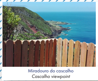
Miradouro do cascalho Cascalho viewpoint