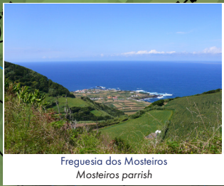
Freguesia dos Mosteiros Mosteiros parish