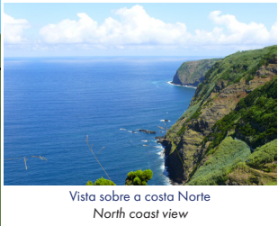
Vista sobre a costa Norte North coast view