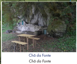
Chã da Fonte Chã da Fonte