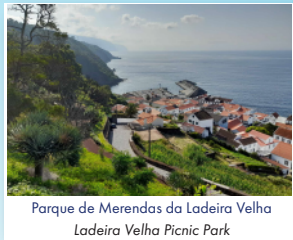
Parque de Merendas da Ladeira Velha Ladeira Velha Picnic Park