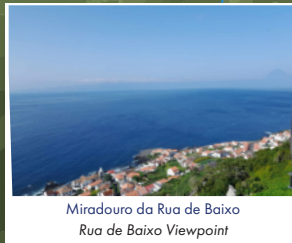
Miradouro da Rua de Baixo Rua de Baixo Viewpoint