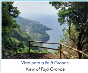
Vista para a Fajã Grande View of Fajã Grande