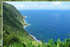
Vista para a Fajã de Além View over Fajã de Além