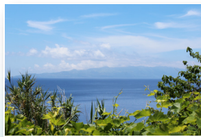
Vista para as ilhas Terceira e Graciosa View to Terceira and Graciosa islands