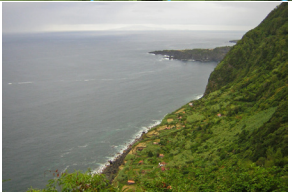
Vista para as Fajãs de Além e do Ouvidor View over Fajã de Além and Ouvidor