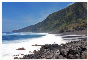
Praia do Norte Praia do Norte beach