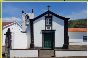
Ermida Nª Sª da Penha de França Nª Sª da Penha de França hermitage