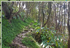
Caminho para a Fajã Path to Fajã