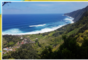
Vista para a Praia do Norte Viewpoint to Praia do Norte