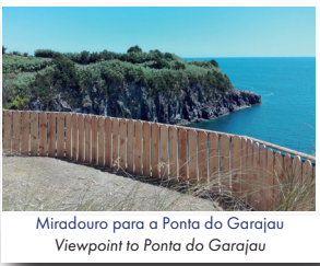
Miradouro para a Ponta do Garajau Viewpoint to Ponta do Garajau