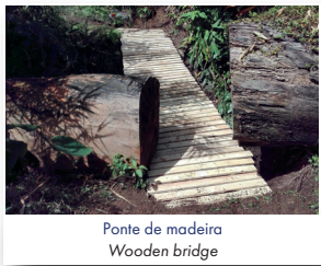
Ponte de madeira Wooden bridge