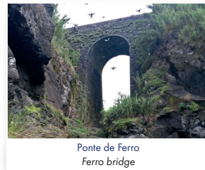
Ponte de Ferro Ferro bridge