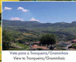
Vista para a Tronqueira/Graminhais View to Tronqueira/Graminhais