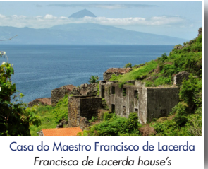
Casa do Maestro Francisco de Lacerda Francisco de Lacerda house's