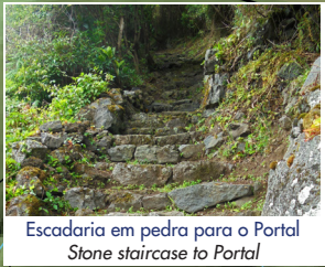
Escadaria em pedra para o Portal Stone staircase to Portal