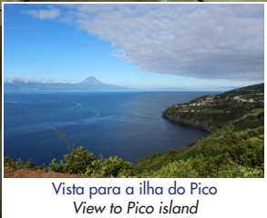
Vista para a ilha do Pico View to Pico island