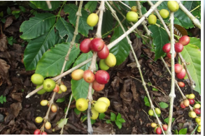
Café produzido localmente Locally produced coffee