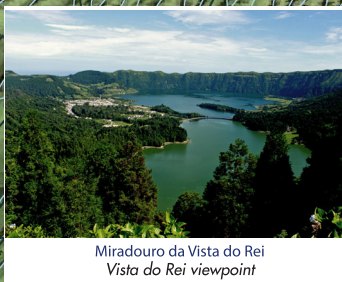
Miradouro da Vista do Rei Vista do Rei viewpoint

Parque Natural de São Miguel São Miguel Natural Park O percurso atravessa áreas protegidas. É responsabilidade de todos nós contribuímos para a sua proteção, bem como assegurar a sua biodiversidade através da conservação destes habitats naturais. The trail goes through protected areas. It's our responsibility to contribute to its protection, as well as to assure its biodiversity through the conservation of these natural habitats.