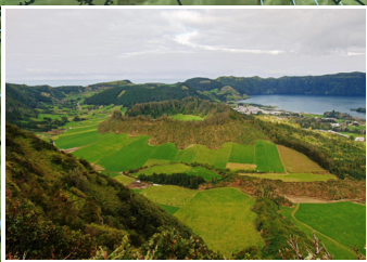
Caldeira dos Alferes Alferes crater