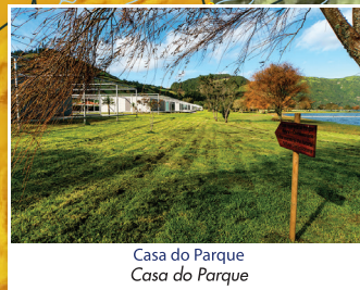
Casa do Parque Casa do Parque