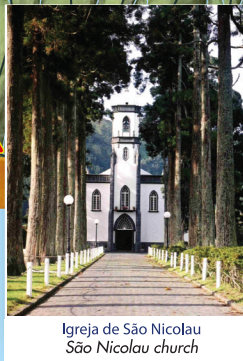
Igreja de São Nicolau São Nicolau church