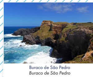
Buraco de São Pedro Buraco de São Pedro