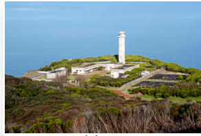
Farol dos Rosais Rosais Lighthouse