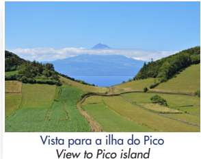
Vista para a ilha do Pico View to Pico island