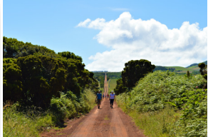
Estrada para a Ponta dos Rosais Road to Ponta dos Rosais