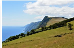
Costa Norte da ilha de São Jorge São Jorge island North coast